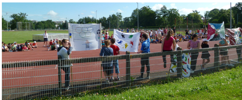
Semaine Olympique 2012